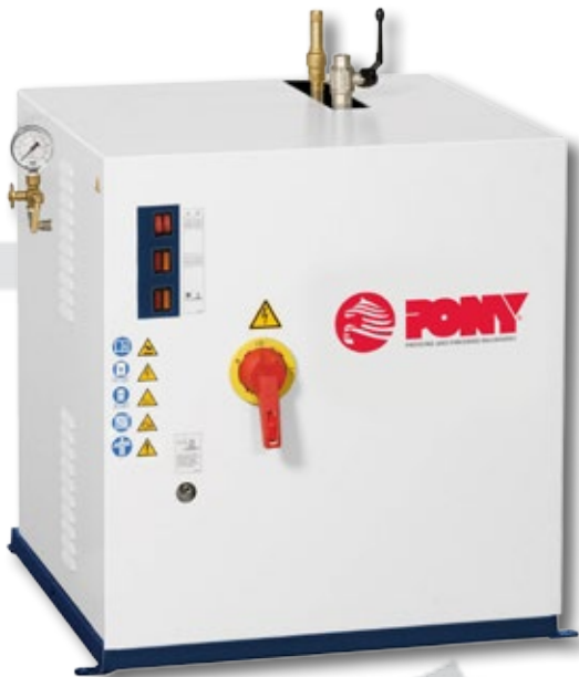
GE-90 + serbatoio